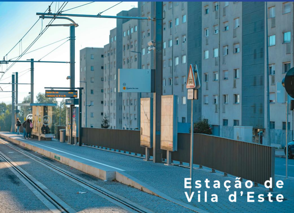
Estação de Vila d'Este