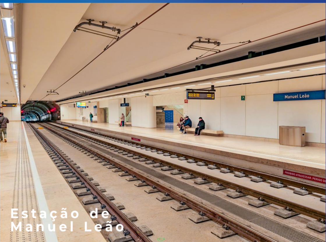
Estação de Manuel Leão

Extensão do Metro do Porto: Linha Amarela (Santo Ovídio - Vila D'Este)