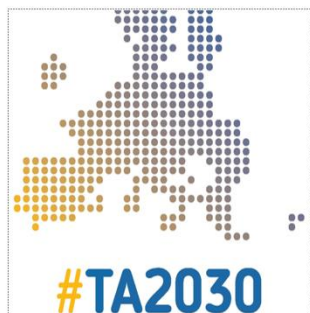
TERRITORIAL AGENDA 2030