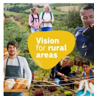
LONG-TERM VISION FOR RURAL AREAS