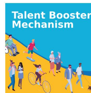
TALENT BOOSTER MECHANISM