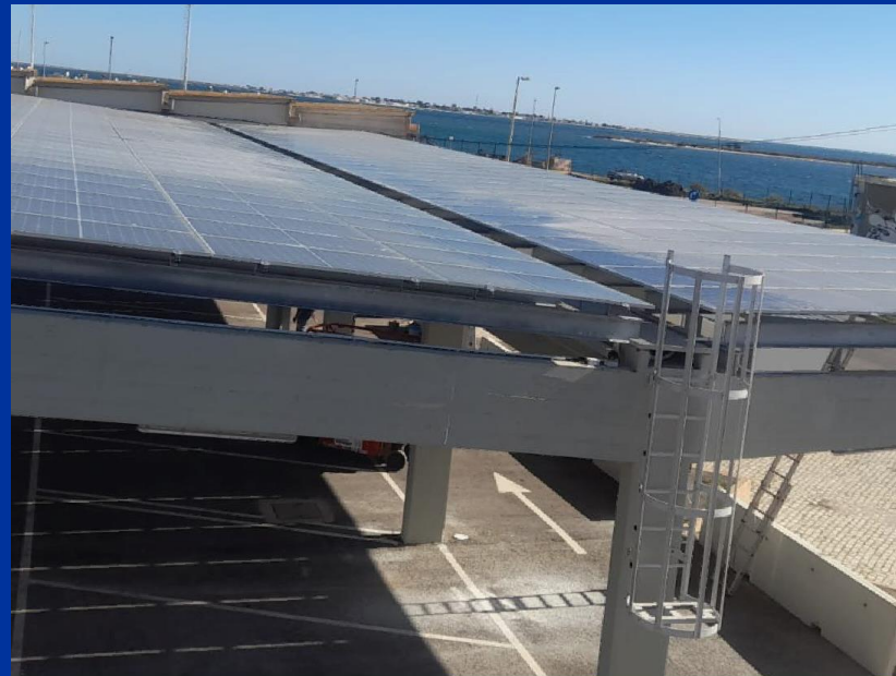
CENTRAL FOTOVOLTAICA OLHÃO