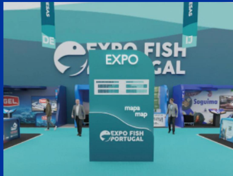
FEIRA VIRTUAL DEDICADA AO SETOR DO PESCADO (2021-2022) EXPO FISH PORTUGAL