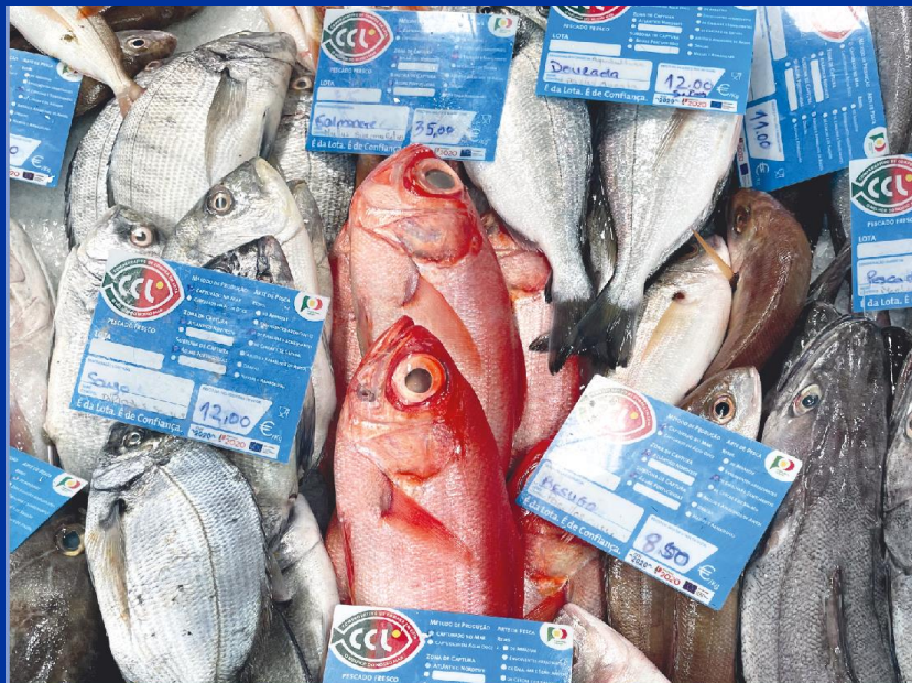
VALORIZAÇÃO DOS PRODUTOS DA PESCA E AQUICULTURA