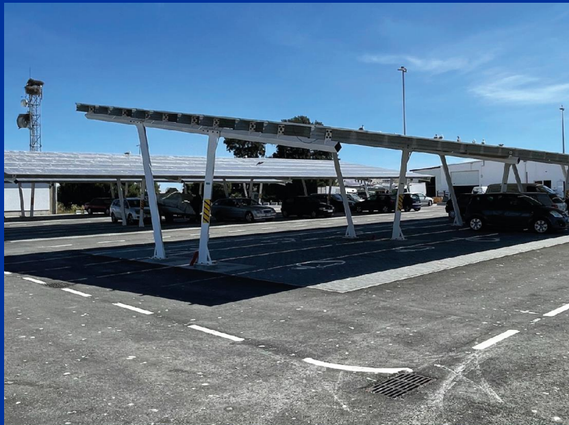
CENTRAL FOTOVOLTAICA RIO ARADE